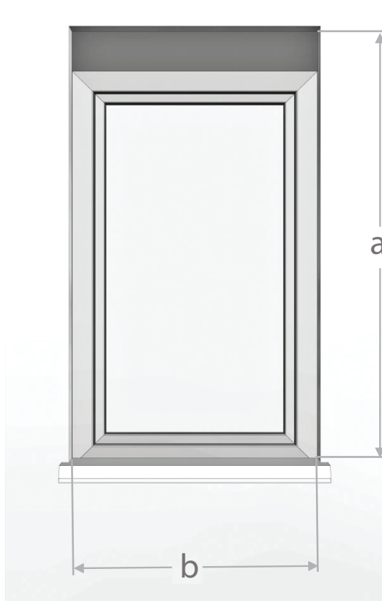
Tabela pomiarowa dla systemu rolety podtynkowej